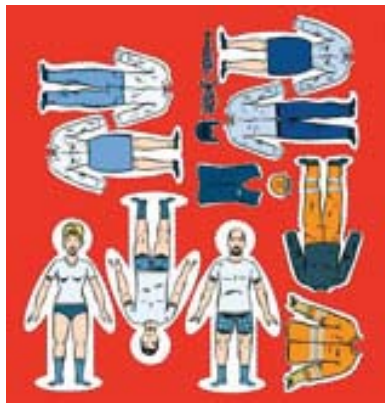
Titelillustration von Andrea Caprez