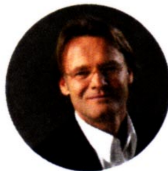
Jörg Stiel, Goalie-Legende

«Für mich gehört zum Erlebnis Ostschweiz ein Spaziergang vor der Haustüre: Bei den «Drei Weihern» oberhalb von St. Gallen lässt es sich im Herbst wunderbar schlendern. Ich mag die Ruhe im Wald und um das Wasser, zwischendurch sieht man auf die Stadt mit den Klosterdächern. Ein Ort, um die Seele baumeln zu lassen und wo es Raum für Gedanken gibt.»