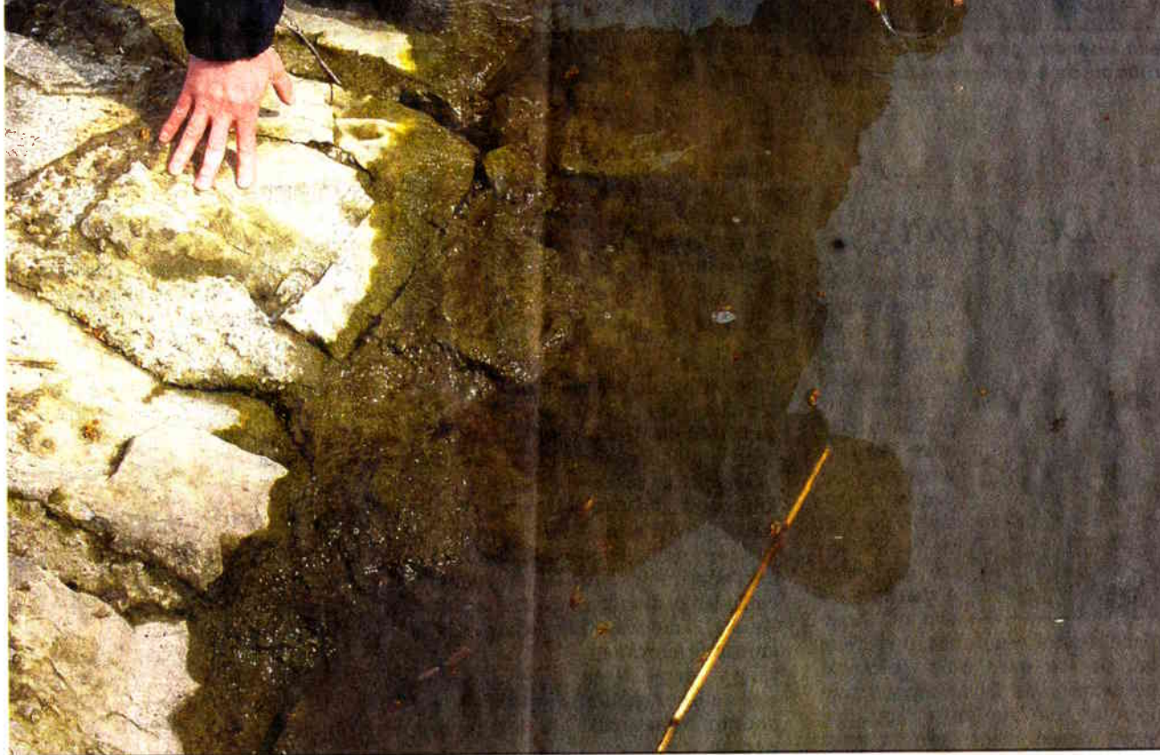
Alfred Fischer entnimmt dem Vierwaldstättersee eine Wasserprobe. Saubere Sache? Nicht immer!

Sowieso ist Fischer diplomatisch um Verständigung bemüht: «Wir suchen oft den Mittelweg für alle Beteiligten.» Manchmal vermittelt er sogar in Fällen, aus denen er sich streng nach Paragraf auch heraushalten könnte. Wenn zum Beispiel eine neue Klimaanlage in der Nachbarschaft für Unmut sorgt, obwohl das Gerät gegen keine gesetzliche Norm verstösst. Der Umweltschutzpolizist